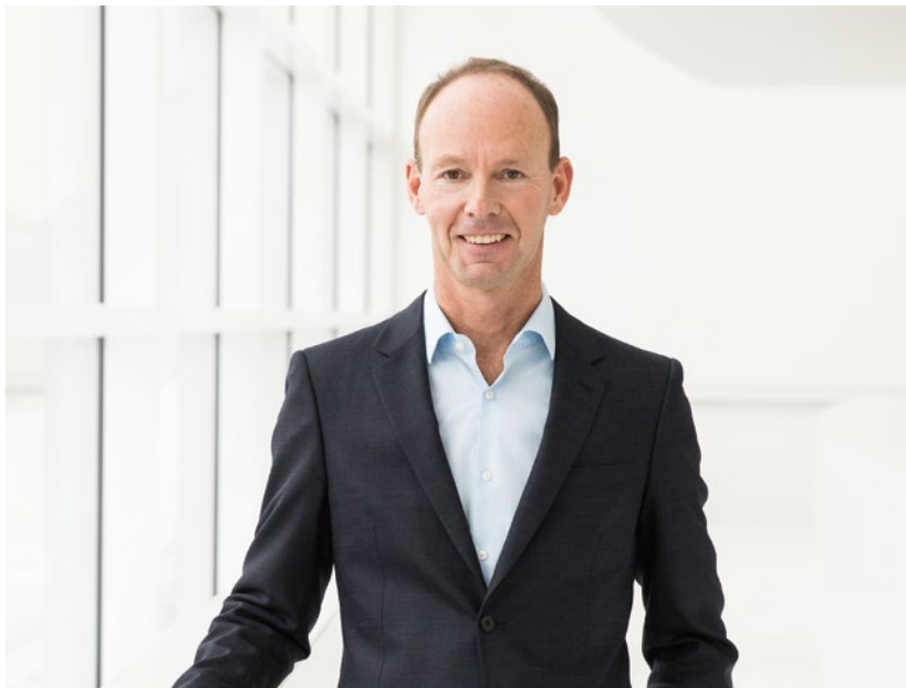
Thomas Rabe Vorstandsvorsitzender von Bertelsmann